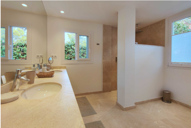
Bad en Suite (Master)