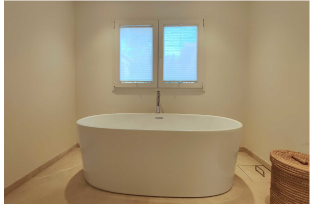
Bad en Suite (Master)