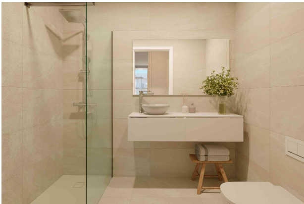
Badezimmer 1 (Rendering)