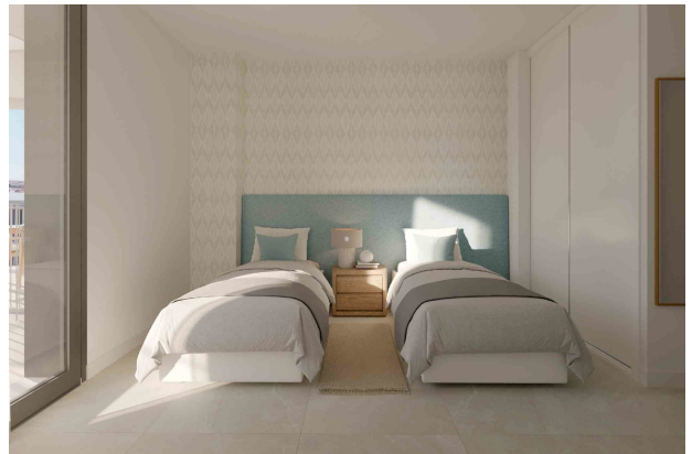
Schlafzimmer 2 (Rendering)