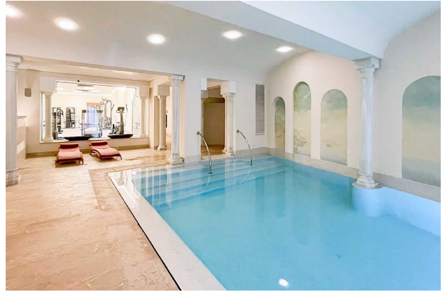
Swimmingpool B beheizt (Gemeinschaft)