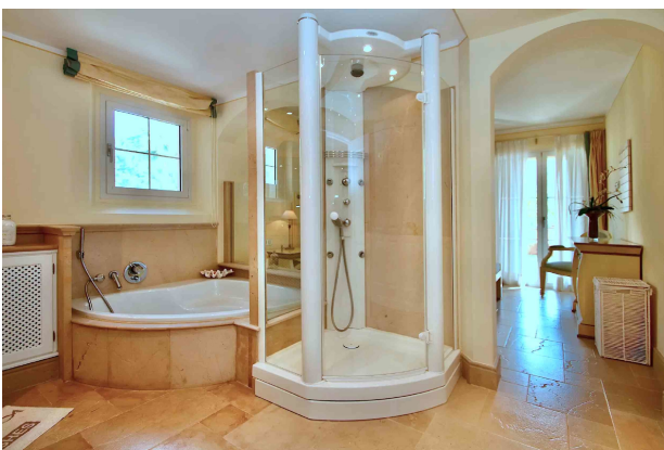
Badezimmer 1 (en Suite)