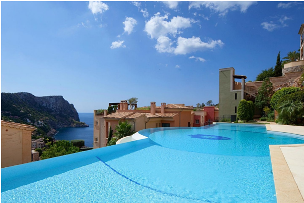
Swimmingpool C (Gemeinschaft)