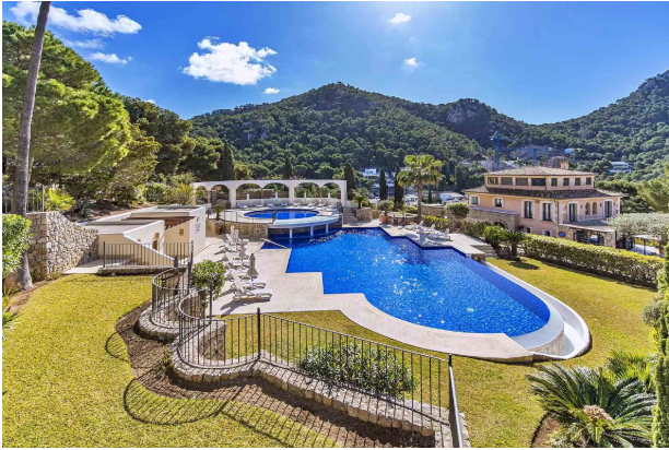
Swimmingpool A (Gemeinschaft)