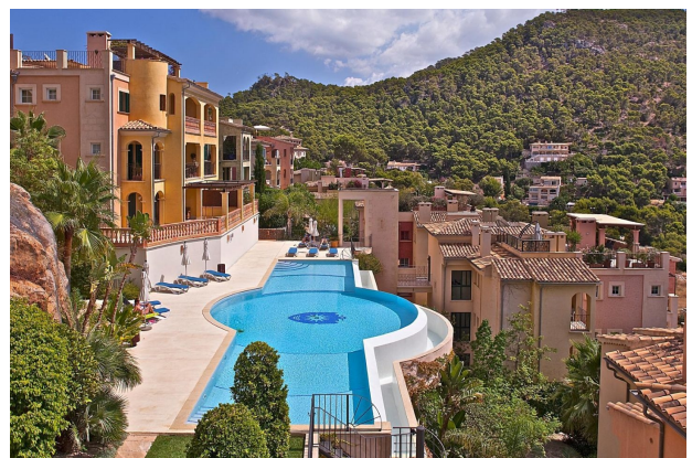
Swimmingpool C (Gemeinschaft)