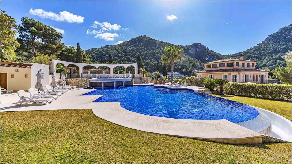
Swimmingpool A (Gemeinschaft)