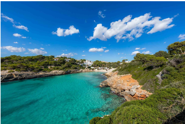
Blick in Richtung Strand