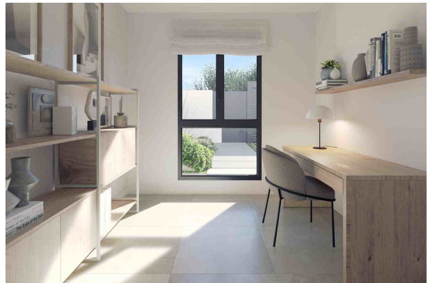
Büro / 4. Schlafzimmer (Rendering)