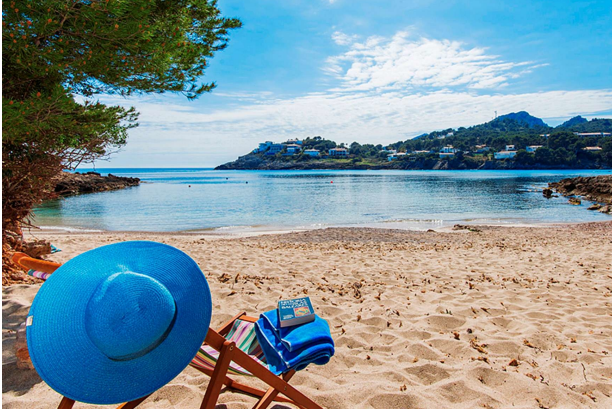
Strand in der Nähe