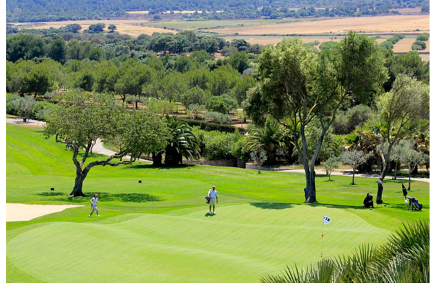
Golfplatz in der Nähe