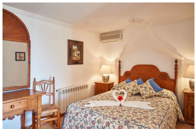
Schlafzimmer 3 (Erdgeschoss)