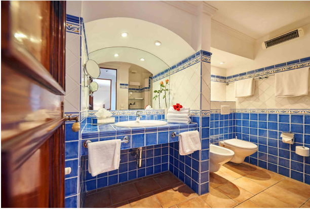
Badezimmer 2 (Erdgeschoss)