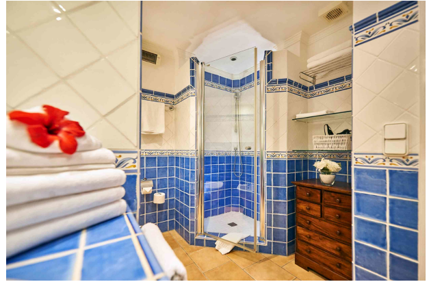
Badezimmer 2 (Erdgeschoss)