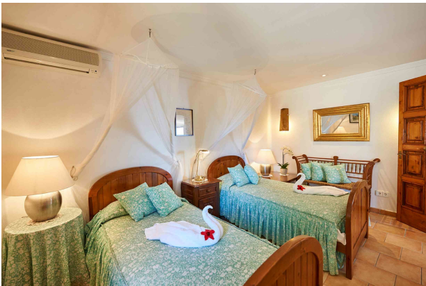
Schlafzimmer 4 (Erdgeschoss)