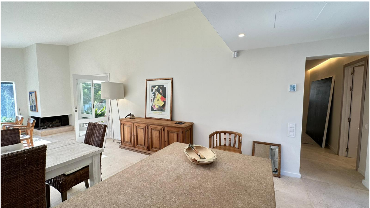
Küche / Essbereich