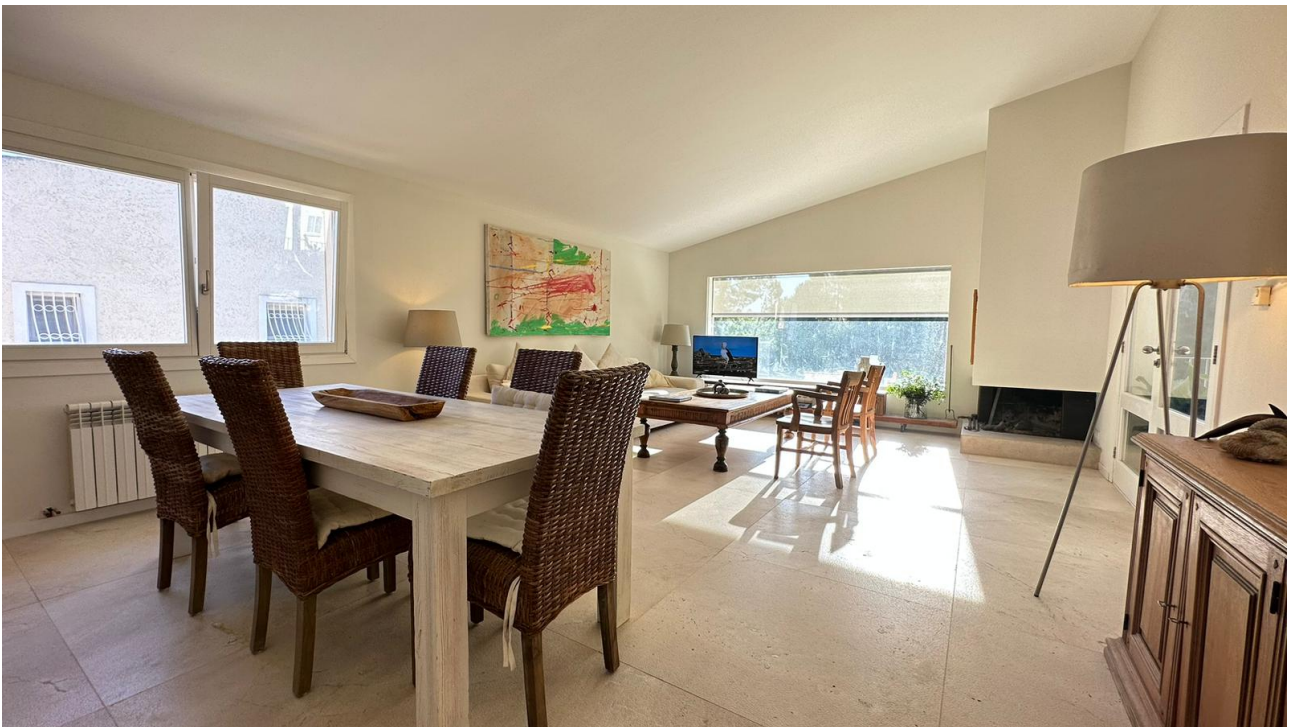
Essbereich / Wohnen