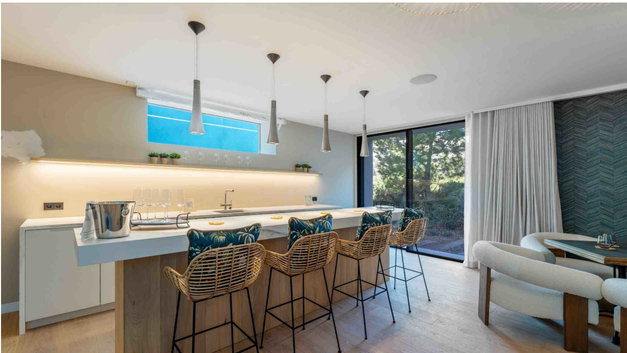
2. Wohnbereich mit Bar