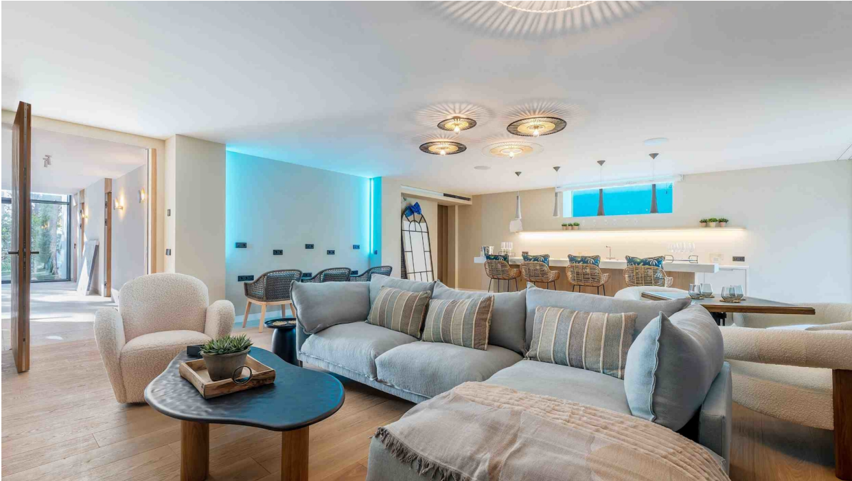
2. Wohnbereich mit Bar