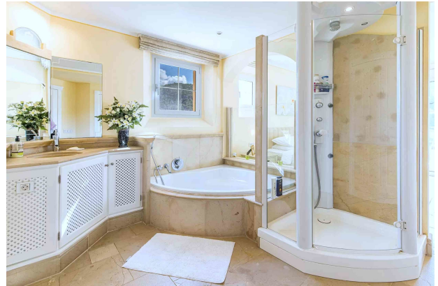
Master Badezimmer 1