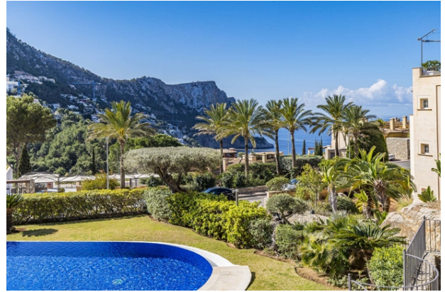
Meerblick Swimmingpool A (Gemeinschaft)