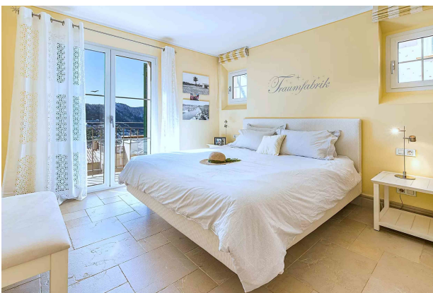
Master Schlafzimmer 2