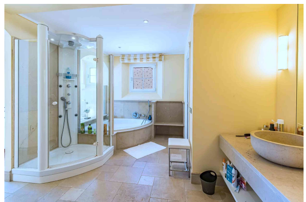
Master Badezimmer 2