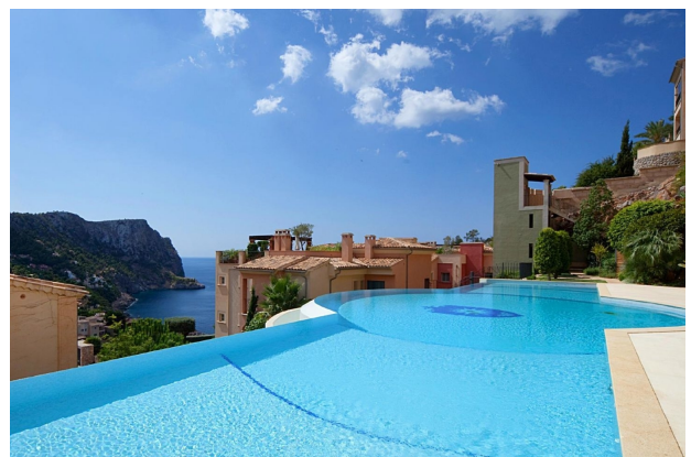
Swimmingpool C (Gemeinschaft)