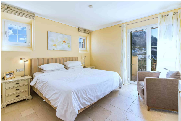
Master Schlafzimmer 1