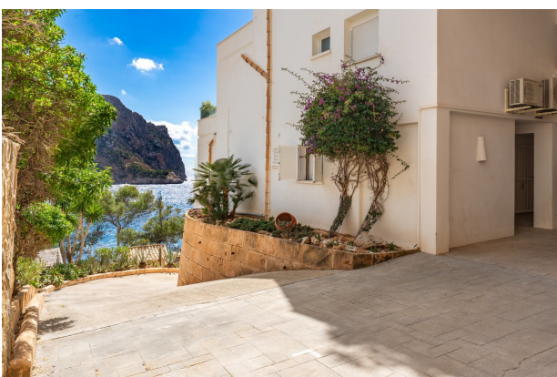
Ausfahrt / Parkplatz