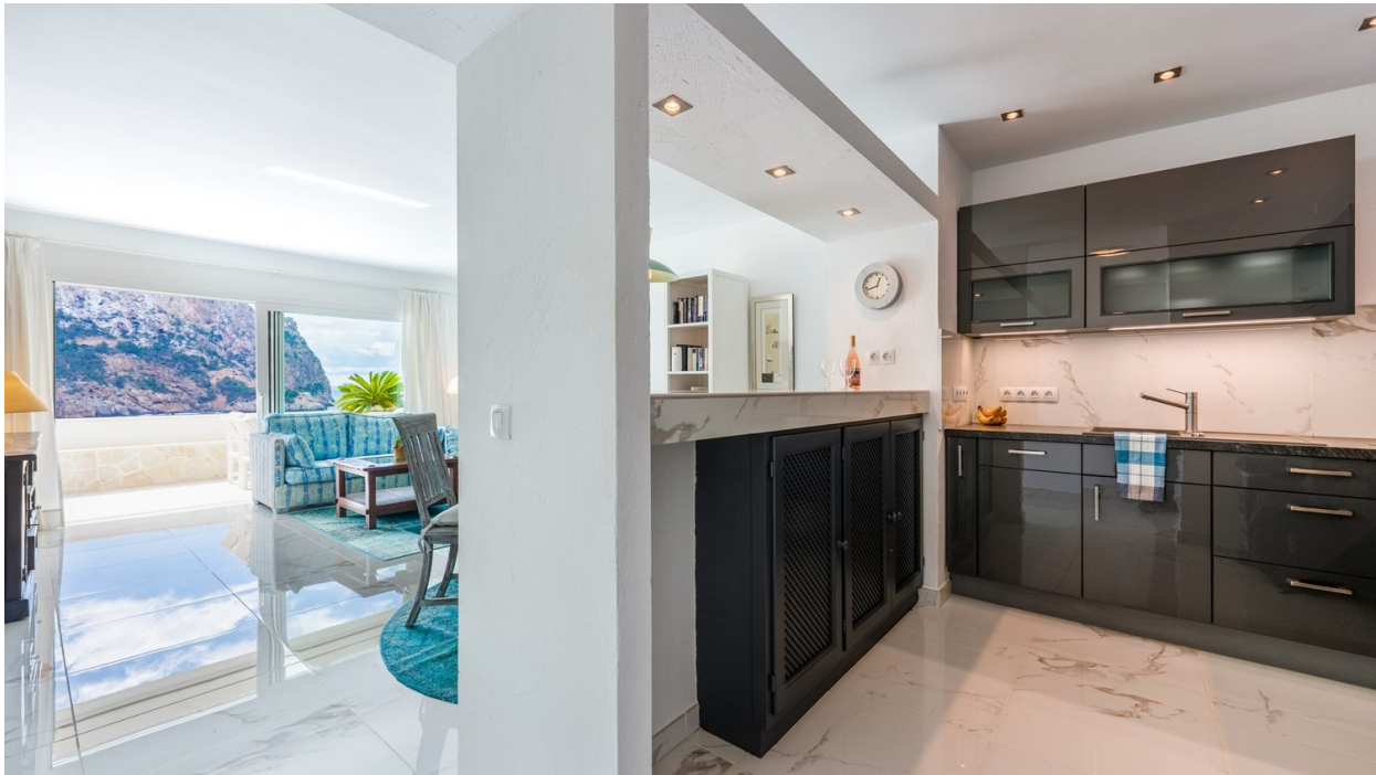
Küche / Wohnen