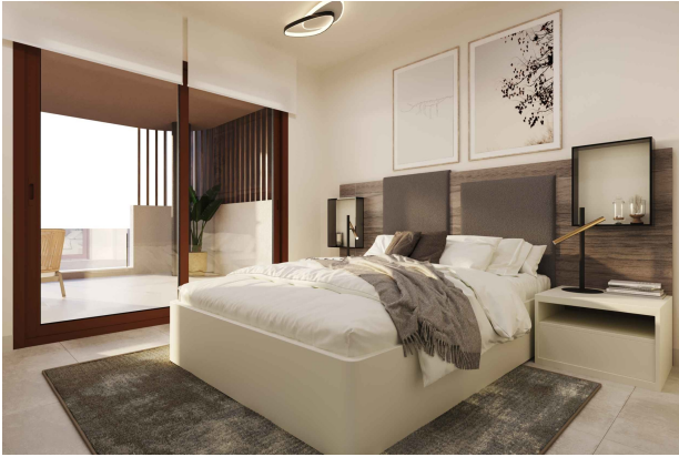
Schlafzimmer 1 (Rendering)