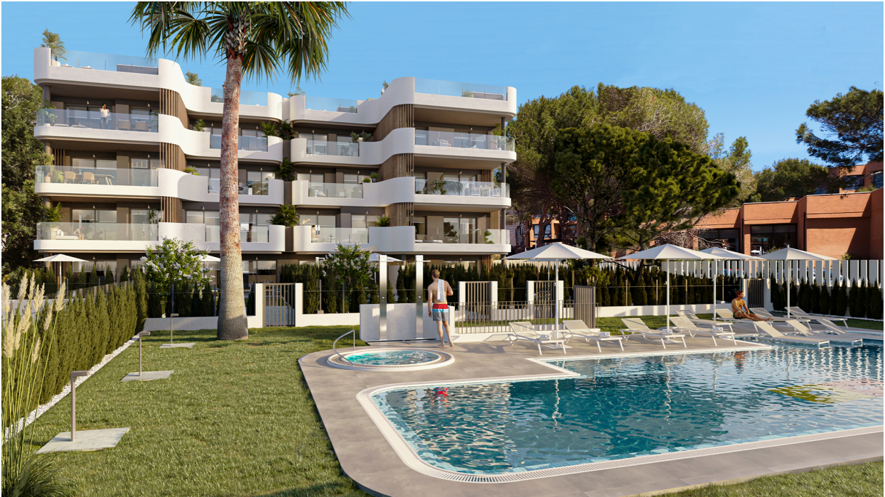
Swimmingpool Gemeinschaft (Rendering)