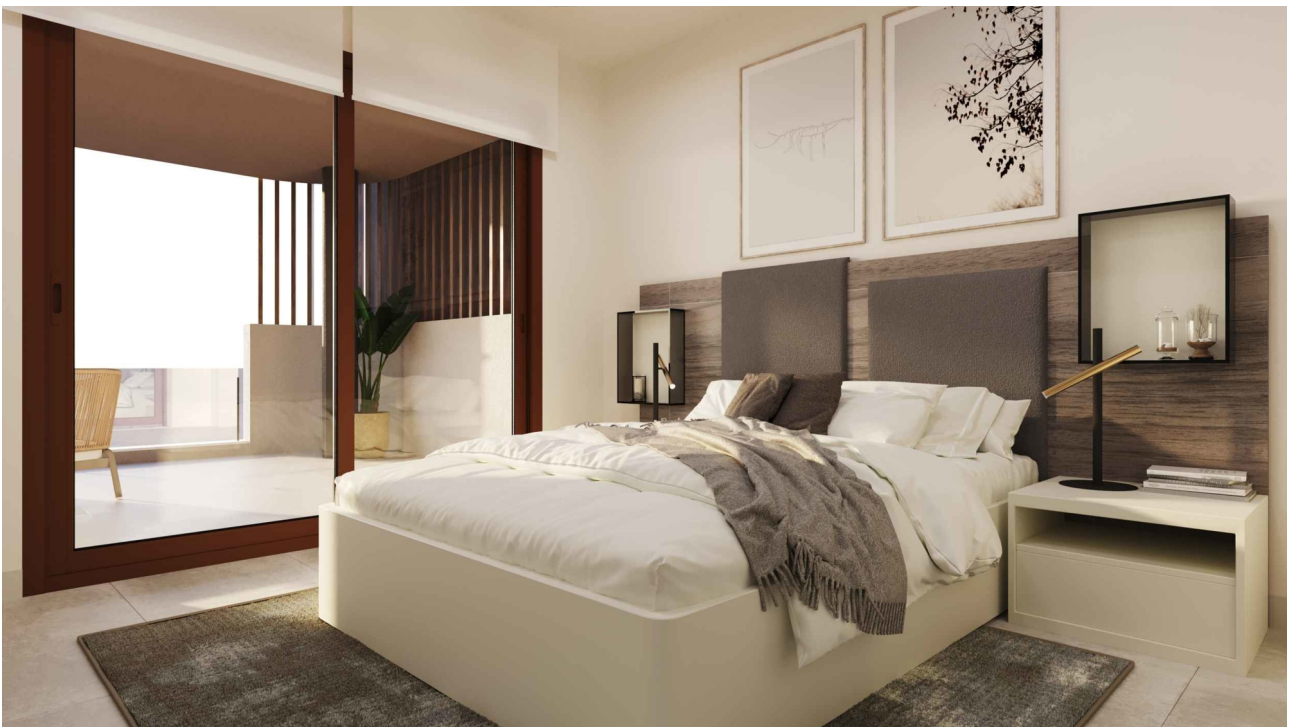
Schlafzimmer 1 (Rendering)