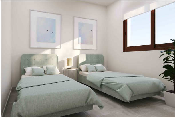
Schlafzimmer 2 (Rendering)