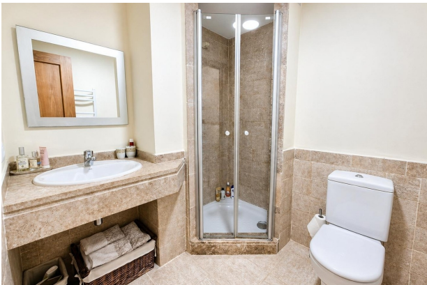
kaufen Wohnung Mallorca