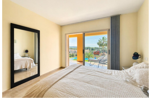
Golfplatz Wohnung kaufen