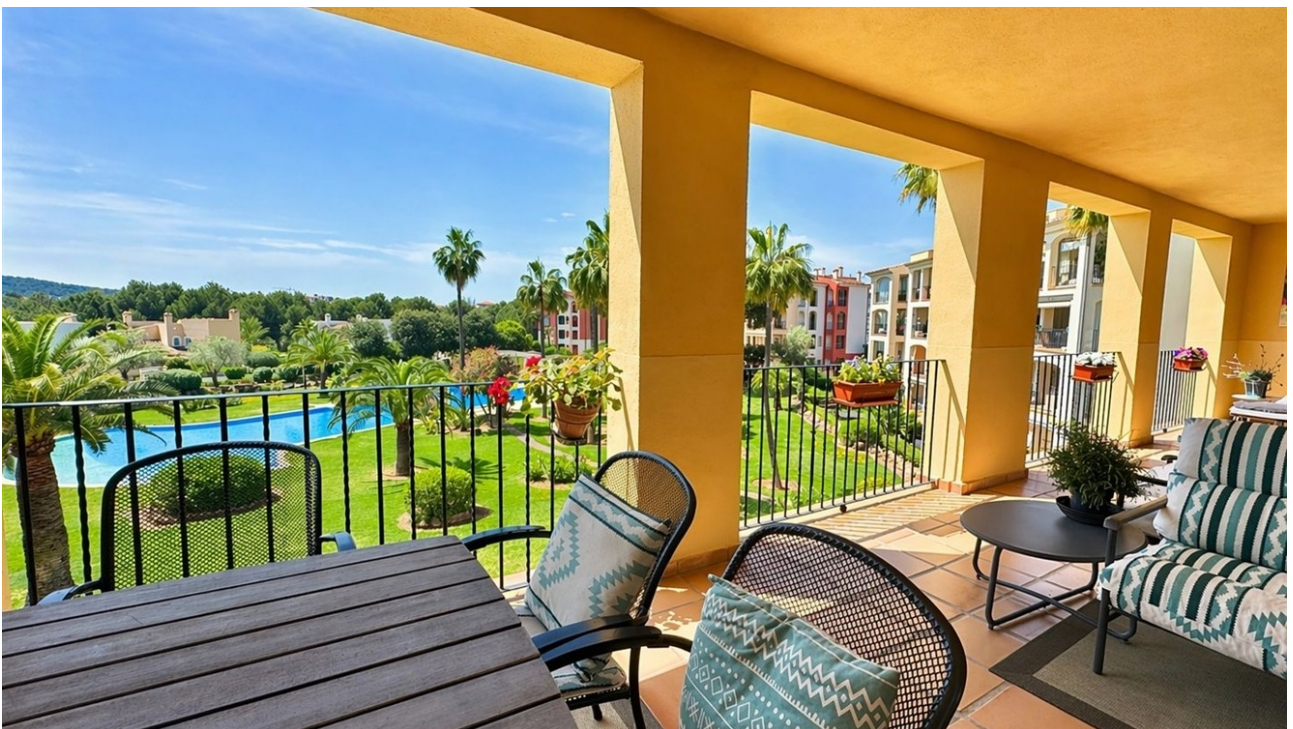
Grosse Süd Terrasse