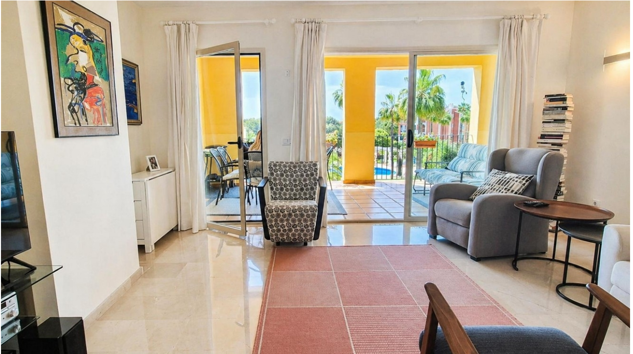
kaufen Wohnung Mallorca