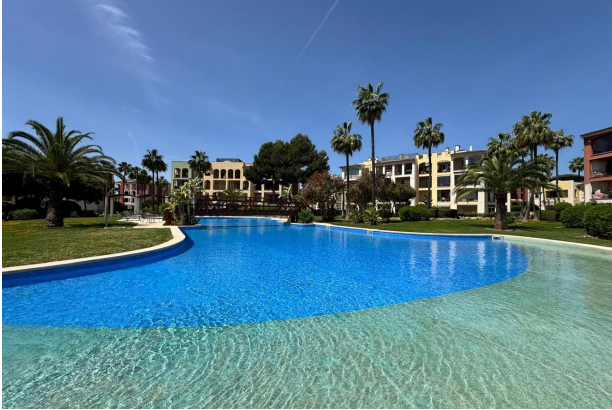
Mallorca kaufen Wohnanlage