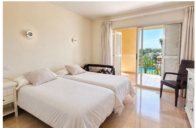
kaufen Port Adriano