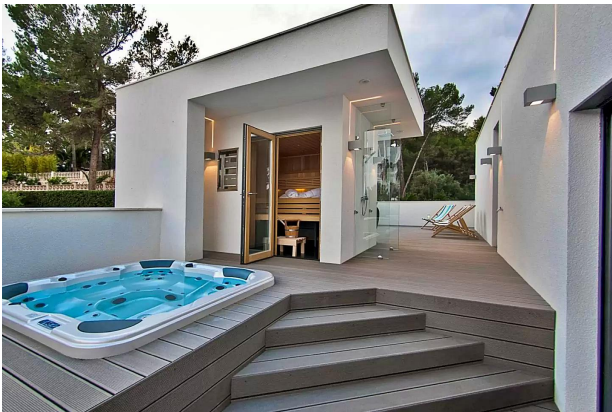
Whirlpool / Sauna