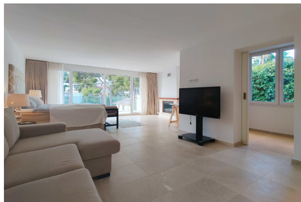
Dormitorio 1 (Master)