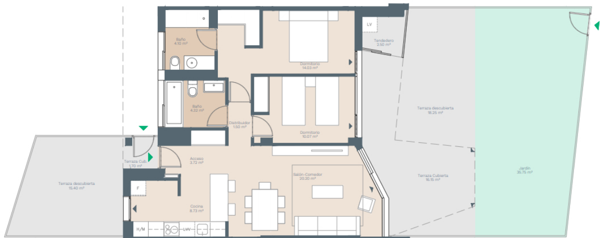
Plano Bloq. C Esc. C P0-A