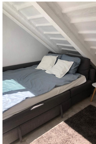
Schlafzimmer 4 (2.OG)