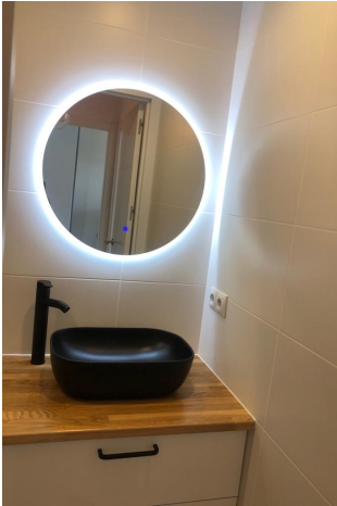
Bad 1 en Suite (1.OG)