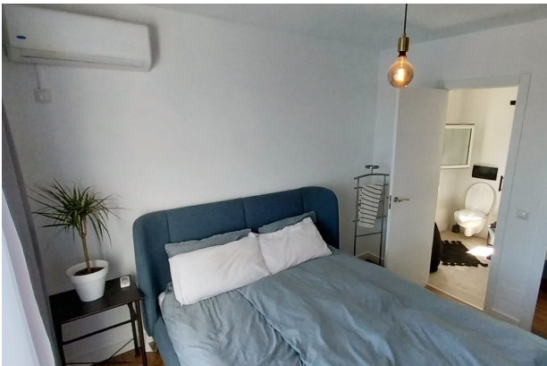
Schlafzimmer 1 (1.OG)