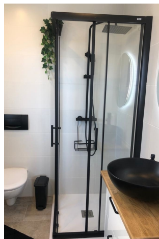
Bad 1 en Suite (1.OG)