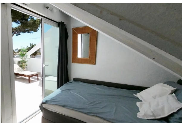
Schlafzimmer 4 (2.OG)