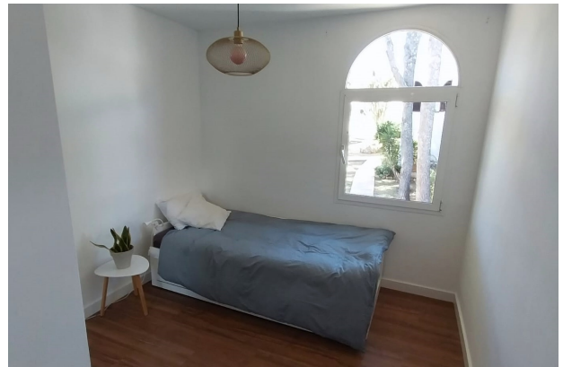
Schlafzimmer 2 (1.OG)