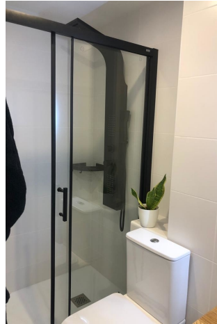
Badezimmer 2 (1.OG)