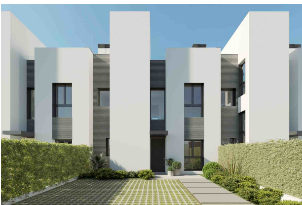
Parking / Entrada (Rendering)