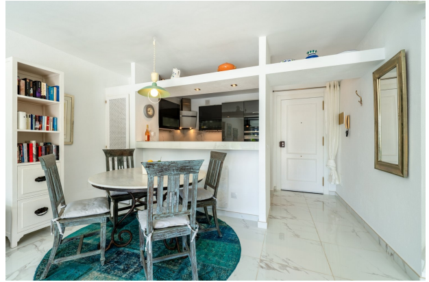
Comedor / COcina