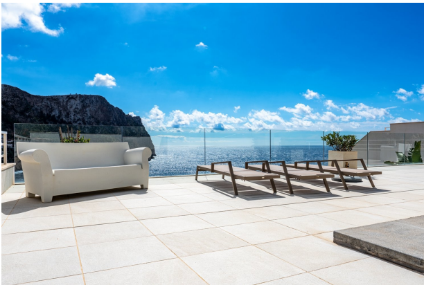
Terraza Piscina (Comunidad)