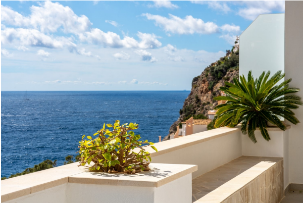
Vista al mar