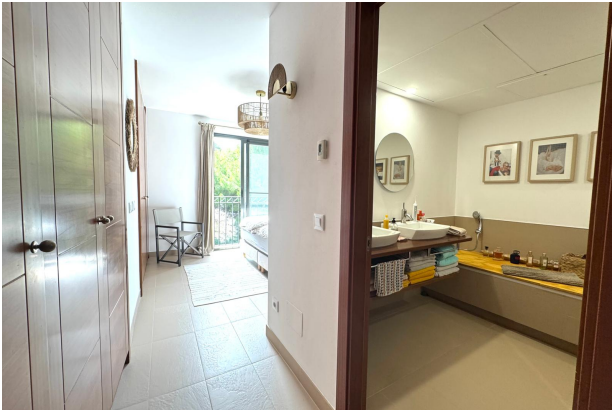
Bano en Suite