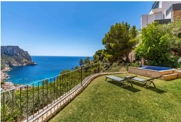
Jardín privado / Vistas al mar