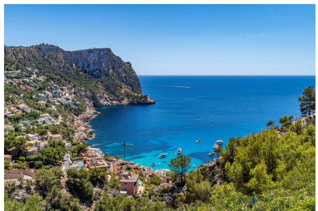
Vista al mar