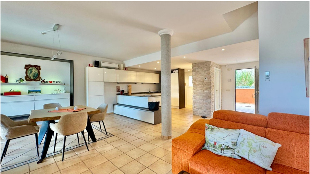
Salón / Comedor