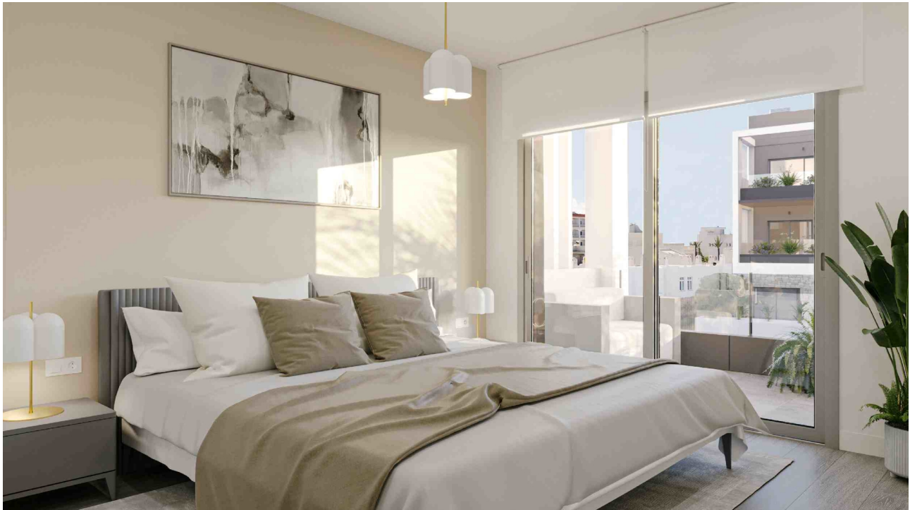
Dormitorio 1 (Rendering)