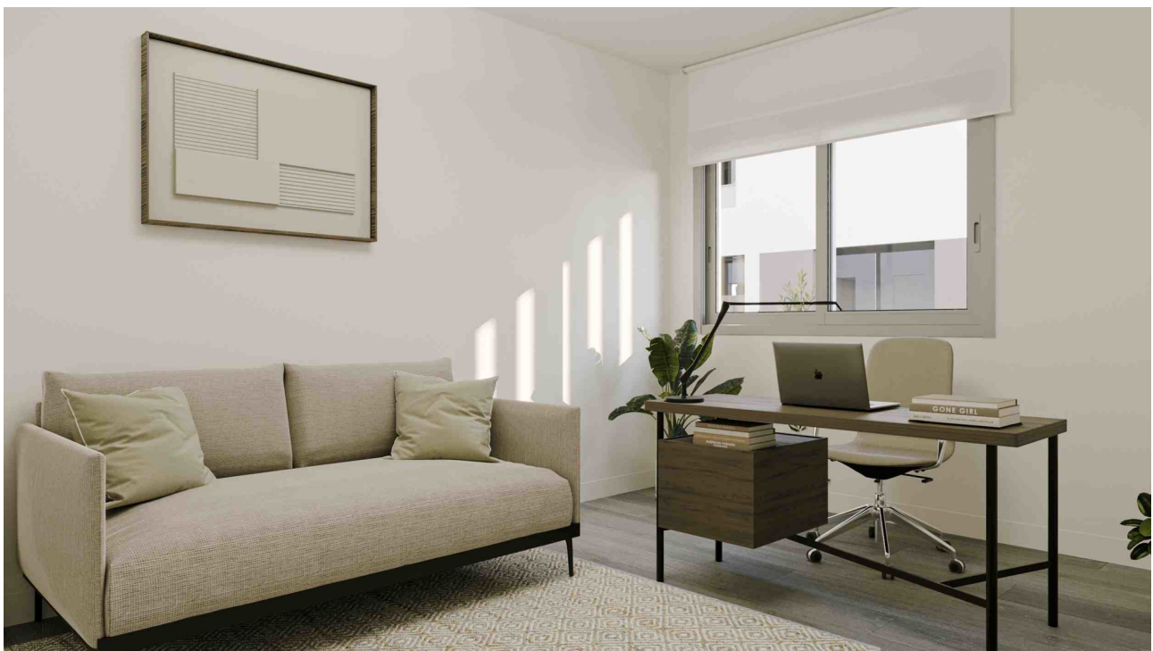
Dormitorio 2 (Rendering)